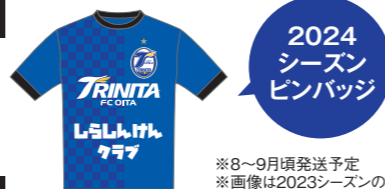
※8~9月頃発送予定 ※画像は2023シーズンのデザインです。