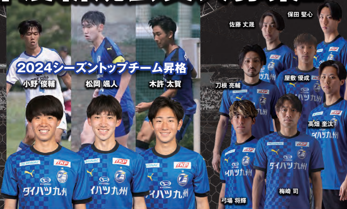
2024シーズントップチーム昇格

大分トリニータアカデミー(ユース、ジュニアユース、ジュニア、レディース、スクール)をサポートすることを目的に設立した、育成年代支援サポートクラブです。魅力あるアカデミー組織を構築し、アカデミーで育った選手が、将来トップチームや、日本代表、そして世界で戦える選手を輩出することを目標にしています。ご協力いただいた会費はクラブ運営費とは完全に切り離し、アカデミー活動の支援だけに使用させていただきます。