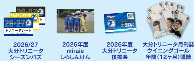
2026/27 大分トリニータ シーズンパス