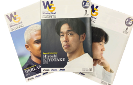
月刊誌 Winning Goal