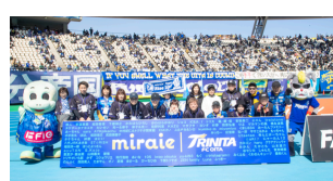
ゴール裏ピッチ看板