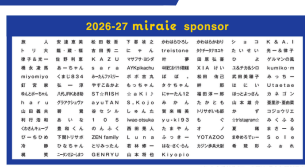
miraie公式ホームページ